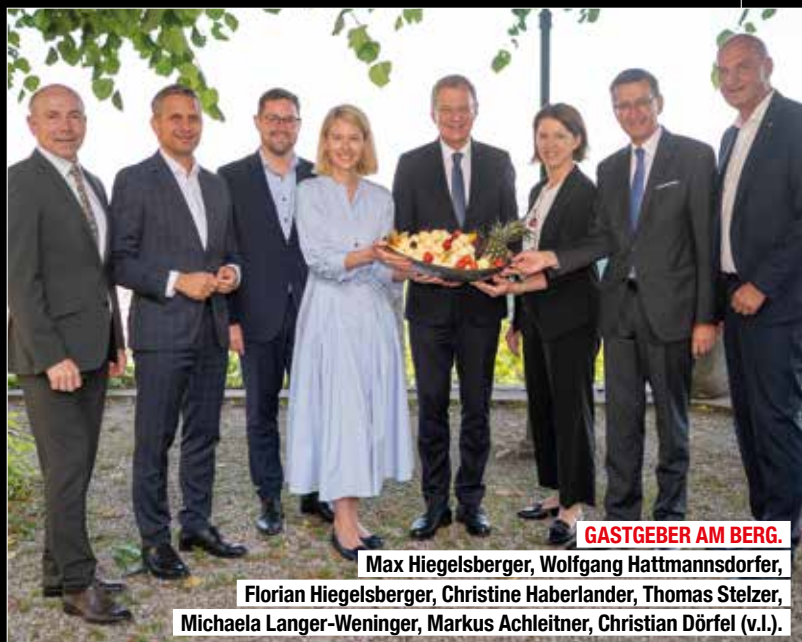
GASTGEBER AM BERG.