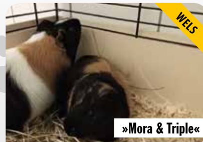
»Mora & Triple«

Die beiden Glatthaar-Meerschweinchen Mora und Triple sind 2 Jahre alt und Schwestern. Sie hängen sehr aneinander und wünschen sich deshalb ein gemeinsames neues Zuhause. Mora und Triple sind sehr neugierig, aufgeweckt, brauchen viel Auslauf und ein großes Freigehege zum Herumtollen, Erkunden und Spielen.